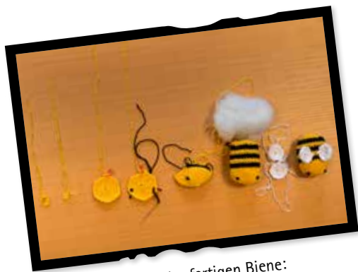
Größe der fertigen Biene: 7 cm lang, 5 cm im Durchmesser